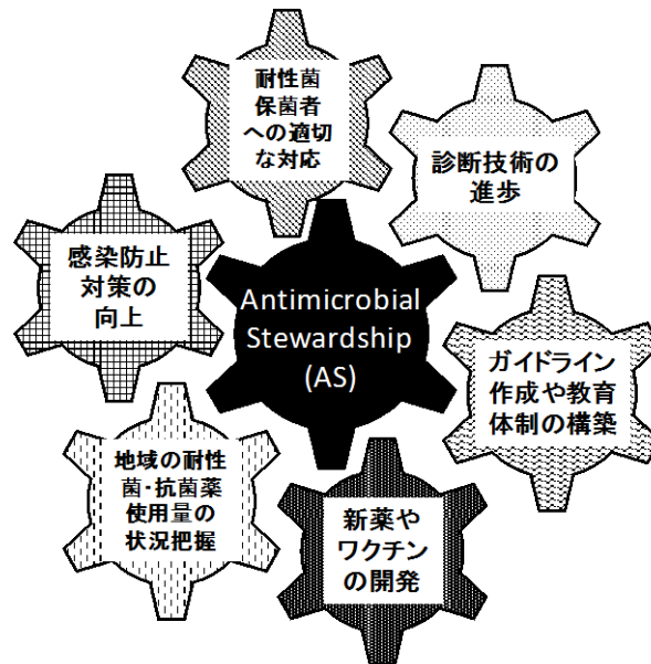
図2 感染症診療における「耐性菌の抑制」と「予後向上」のための方策